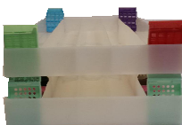
Paraffinblock Tray doppelt.

I. Archivierungsschrank zur Lagerung von ca. 154.000 Standard-Objektträgern 76 x 26 mm oder ca. 21.200 Paraffinblöcke bei einfacher Lagerung 10 Vollauszugsschubladen (100 % ausziehbar) inkl. Trays Maße: H x B x T 1100 x 1046 x 750 mm